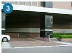
グランドハイアット 福岡のエントランス 脇