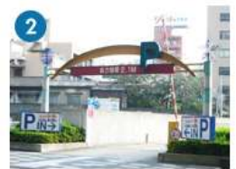
キャナルシティ・福岡ワシントンホテルの向かい側

ショールーム最寄りの入口は ②ワシントンホテルの向かい側 です。 Fエリア に停めていただくとビジネスセンタービルのエレベーターに近くなっております。 こちらのエレベーターにて 3階 までお越し下さい。