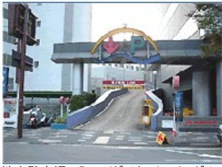
地上駐車場の入口はビジネスセンタービルの正面向かって左側

地上駐車場の入口は、ビジネスセンタービル（1Fに西日本シティ銀行があります）の正面向かって左側、ローソン横にあります。