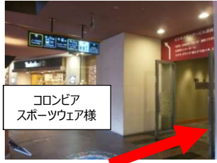
コロンビアスポーツウェア様