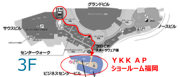
YKK AP ショールーム福岡

エレベーターまたはエスカレーターにて3階へお越し下さい。 エレベーターから直進し、 左手に噴水のあるサンプラザステージが見えたら 右折し連絡通路を渡ってください。 直進していただくと正面にYKK APショールームがあります。