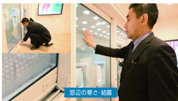
断熱性・防露性（結露）