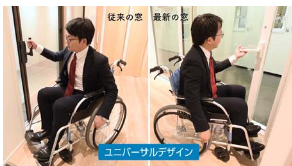
使いやすさ（操作性）