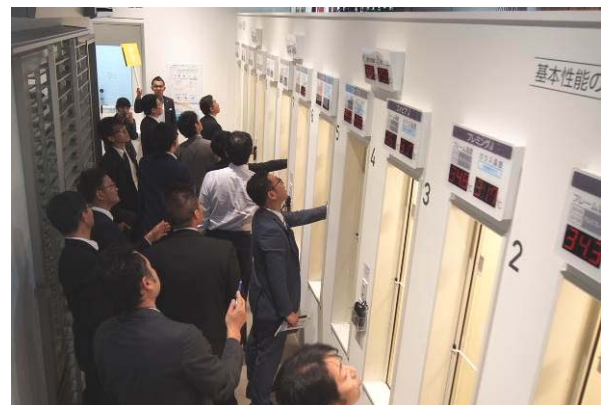
窓による遮熱性能の違いを体感中の様子