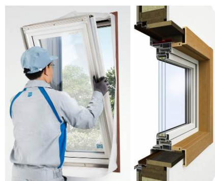
窓リフォーム商品「かんたん マドリモ」