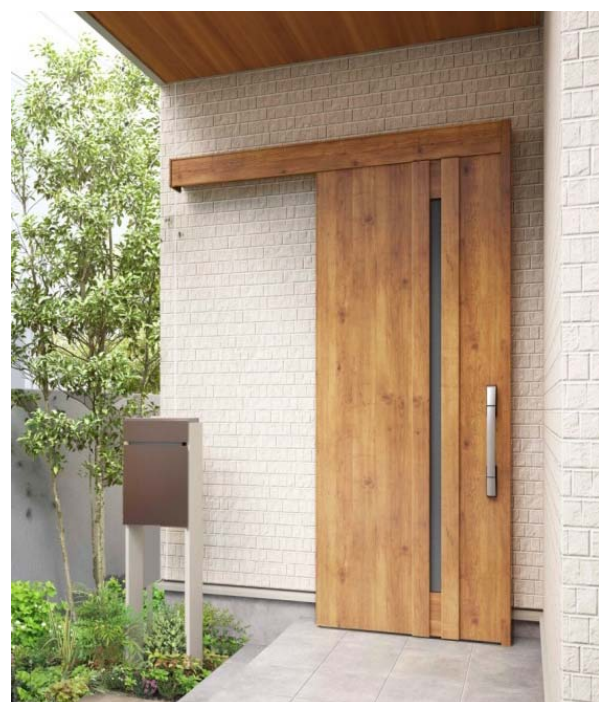
新デザイン B07（外引込みタイプ）