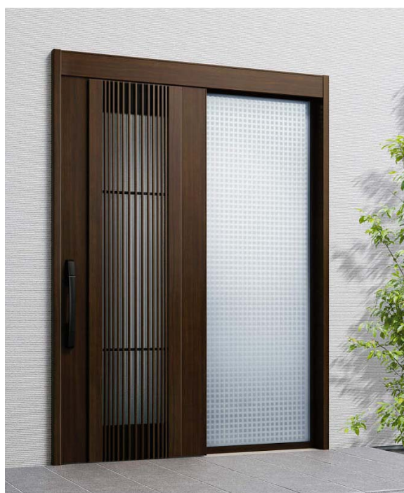
新デザイン W05（袖付タイプ）