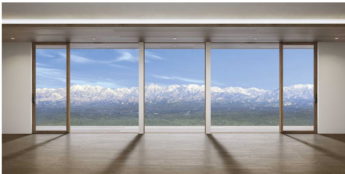
「APW 511」大開口スライディングを片引き窓+FIX窓+片引き窓の構成で並べて施工したイメージ

YKK AP株式会社（本社：東京都千代田区、社長：堀 秀充）は、圧倒的な眺望・採光・開放感と、高い断熱性を両立した住宅用窓「 エービーダブリュー APW 511」大開口スライディングを2019年6月25日から発売します。