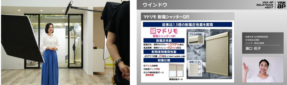
(左)新商品紹介動画の撮影風景 (右)プレゼンテーション視聴イメージ

プロユーザー向け技術提案施設 YKK AP「パートナーズサポートスタジオ」(富山県黒部市)で実際の商品を撮影した「新商品紹介動画」や、企画・開発担当者による「商品特長プレゼンテーション動画」をご覧ください。