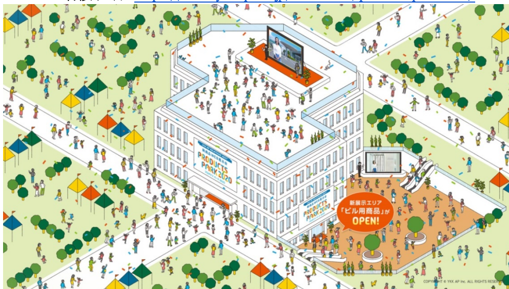
ビル用商品エリアとして地下1・2階を新設した仮想展示会場の様子

<特設サイト： https://www.ykkap.co.jp/exhibition/productspark2020/ >