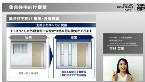
(左) ビル用商品ダイジェストムービー (右) 建築用途別提案ムービー